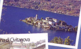
Lanciano - Fontana di Civitanova